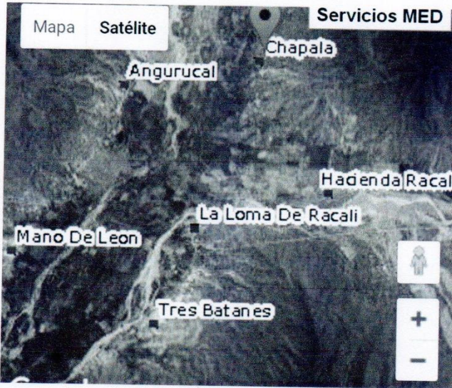
UBICACIÓN GEOGRAFICA DE LA COMUNIDAD