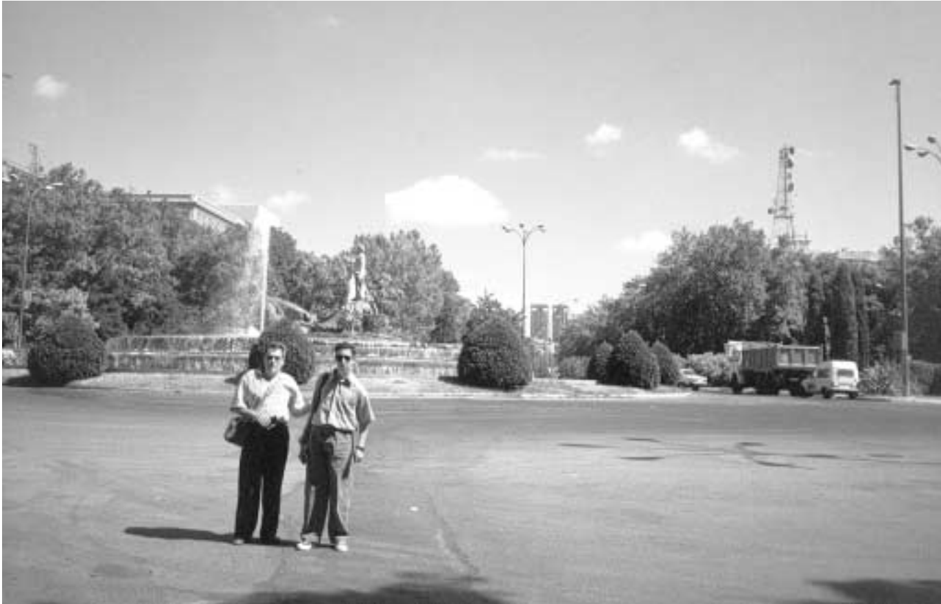
EL ATLETI FUE PASIÓN Y AFICIÓN. AQUÍ, CON SU PADRE, EN LA FUENTE DE NEPTUNO, EL LUGAR PARA CELEBRAR LOS TRIUNFOS.